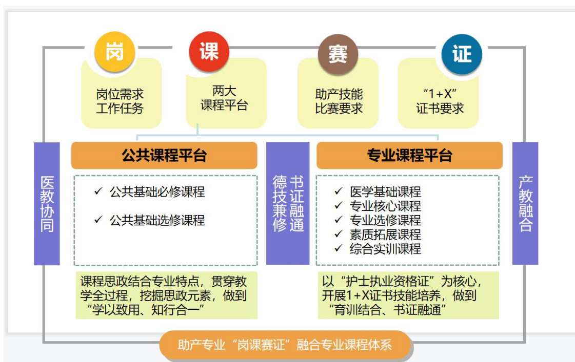
图2 助产专业“岗课赛证”融合课程体系