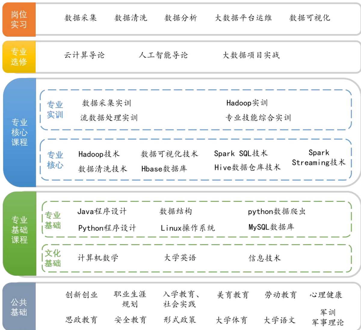
图 2 课程结构图