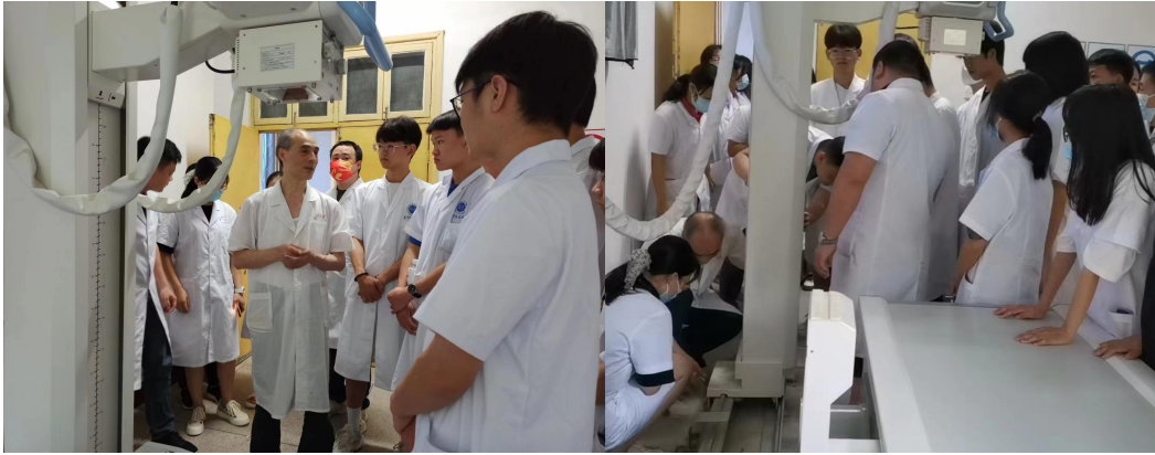
讲解安健 DR 管头上下移动卡死故障现象并分析可能的原因