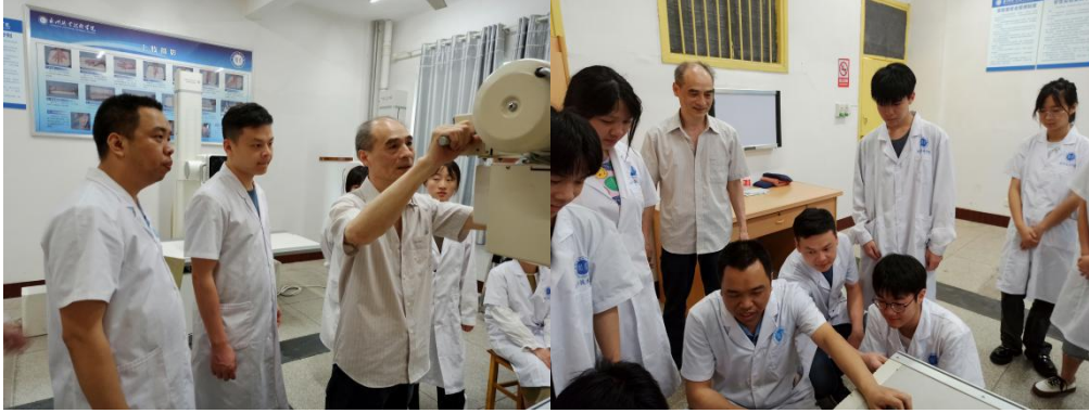
讲解万东 X 线机锁止器故障和曝光故障现象并分析可能的原因