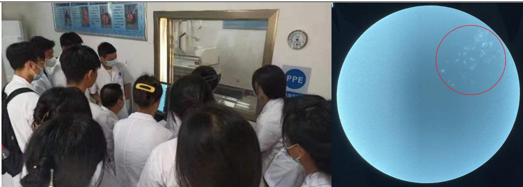
讲解数字胃肠机图像上伪影现象并分析可能的原因